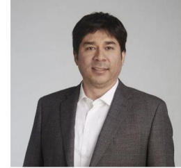
Boris Olguín Morales

Presidente de Empresas de Ferrocarriles del Estado, EFE