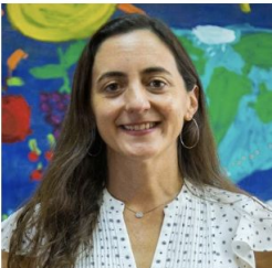
María Emilia Undurraga

Decana Facultad de Ciencias de la Naturaleza USS. Ex Ministra de Agricultura.