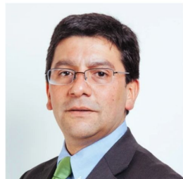
Pablo Badenier Martínez

Board Member CAP S.A. y WWF-USA. Ex Ministra de Medio Ambiente