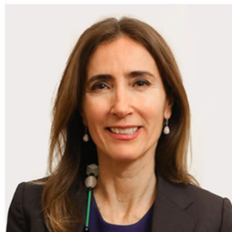
Carolina Schmidt Zaldívar

Board Member CAP S.A. y WWF-USA. Ex Ministra de Medio Ambiente