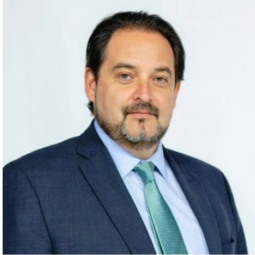
Andrés Rebolledo Smitmans

Secretario Ejecutivo OLADE (Org. Latinoamericana de Energía). Ex Ministro de Energía.