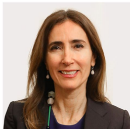
Carolina Schmidt Zaldívar

Board Member CAP S.A. y WWF-USA. Ex Ministra de Medio Ambiente