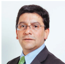
Pablo Badenier Martínez

Board Member CAP S.A. y WWF-USA. Ex Ministra de Medio Ambiente