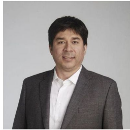
Boris Olguín Morales

Presidente de Empresas de Ferrocarriles del Estado, EFE