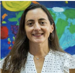
María Emilia Undurraga

Decana Facultad de Ciencias de la Naturaleza USS. Ex Ministra de Agricultura.